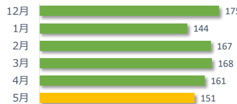
相談件数の推移（直近 6 か月）

遺族等の求めに応じて相談内容をセンターが医療機関へ伝達したものは 1 件でした。（累計 20 件）